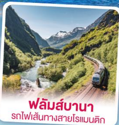
ฟลัมส์บานา รถไฟเส้นทางสายโรแมนติก