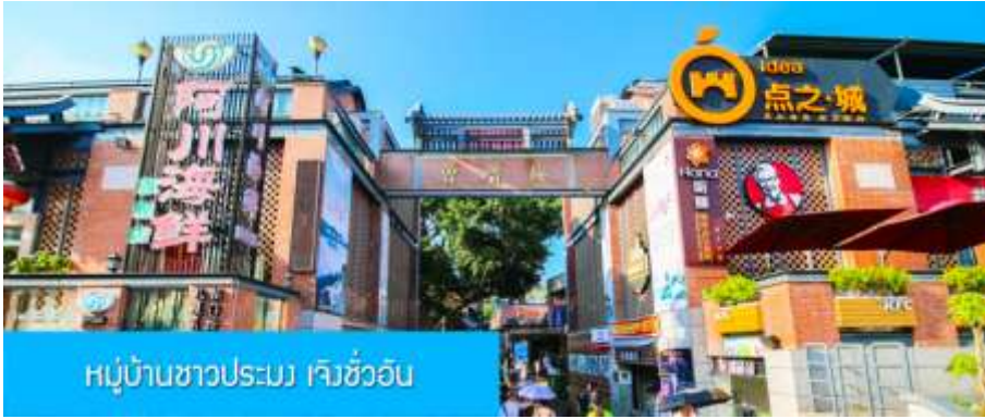
หมู่บ้านชาวประมง เจิงชว้ออัน