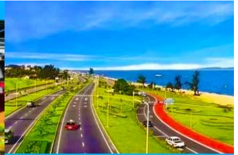
ถนนหวนเต่าลู่