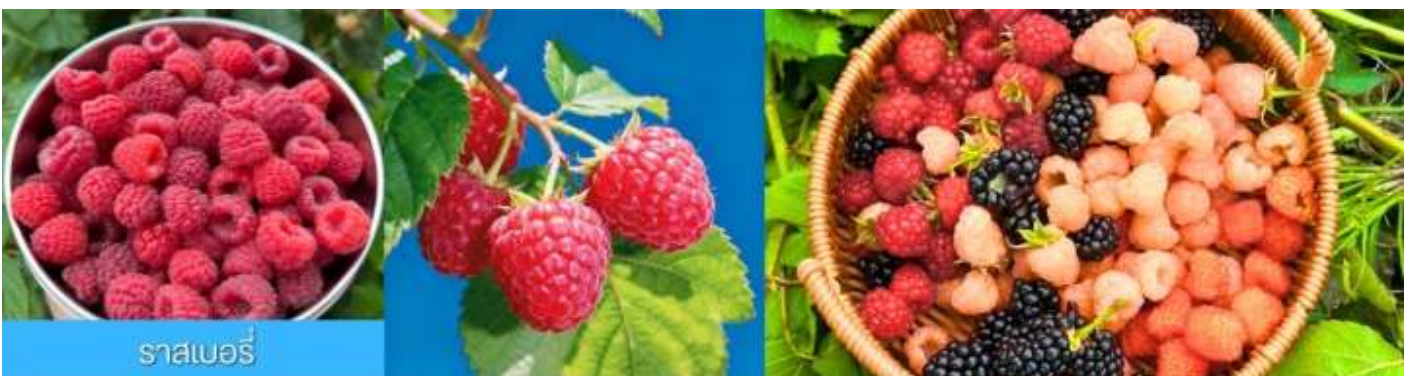
ราสเบอร์รี่