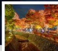
อุโมงค์เมบิล