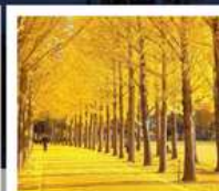
สวนเอ็ทซึโป