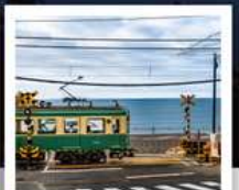
รถไฟโอบะเด็น