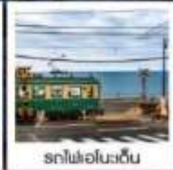
รถไฟเอโนะเด็น