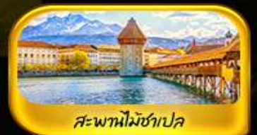
สะพานไมซ์าเปลา