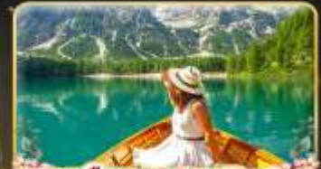
พายเรือทะเลสาบ Braies