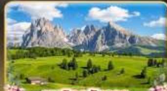
ชมวิวอลังการ alpe di siusi