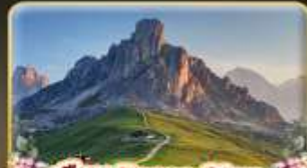
เยือน Passo Giau