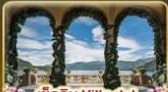
เชคอิน Villa del Balbianello

ที่สุดของธรรมชาติแห่งอิตาลี ทิวเขา ทะเลสาบ ความงามแห่งโคโลโม