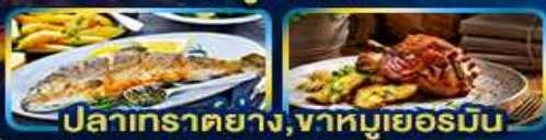
ปลาเทราต์ย่าง, วาหหมูเยอรมัน

Season Germany Austria Czech of romance.. Slovenia Hungary