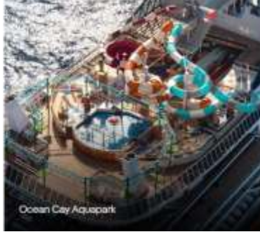
Ocean City Aquapark