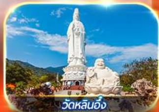
วัดหลินอิ่ง