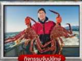
กิจกรรมจับปูยักษ์