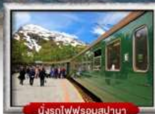
นั่งรถไฟพرونสปานา

พิเศษ! พักบนเรือสำราญ แบบ Window Room 2 คืน, พักบ้านซานต้าคลอส