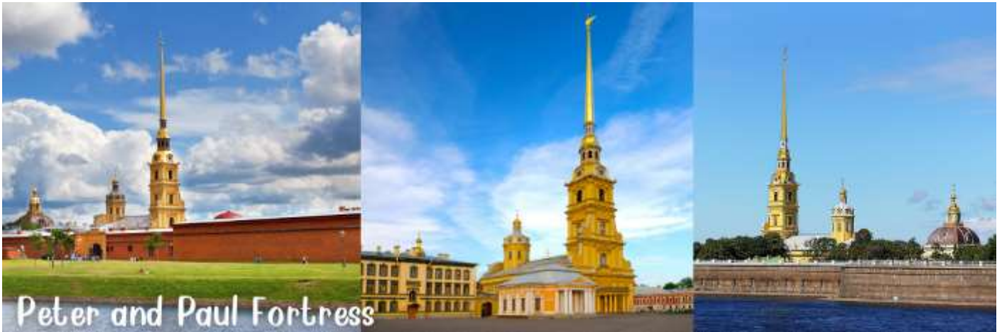
Peter and Paul Fortress

กลางวัน 📍 รับประทานอาหาร ณ ภัตตาคารท้องถิ่น นำท่านชม บ้อมปีเตอร์ แอนด์ ปอลด์ (Peter And Paul) เป็นสิ่งก่อสร้างแรกสุดของเมือง St Petersburg สร้างในปีค.ศ 1703 เป็นอนุสรณ์ชัยชนะสงครามเหนือสวีเดน ด้วยศิลปะแบบบารอกเพื่อใช้เป็นป้อมปราการในการป้องกันข้าศึกกรุกราน ตั้งอยู่บน เกาะวาซิลเยฟสกี (Vasilievsky Island) ลักษณะเป็นรูปทรงหกเหลี่ยม กำแพงเป็นหินก่ออิฐ ส่วนวิหารปีเตอร์ แอนด์ ปอลด์ (Peter-and-Paul-Fortress) เริ่มสร้างขึ้นเมื่อปีค.ศ 1712 ด้วยการ ออกแบบของ DomennicaTrezzini สร้างเสร็จในวันที่ 29 มิถุนายน ค.ศ 1733 ตั้งชื่อวิหารแห่งนี้เพื่อเป็นเกียรติแด่นักบุญปีเตอร์ และนักบุญปอลด์เพื่อเป็นการเผยแพร่ศาสนา ความสูงของยอดแหลมคือ 122.5 เมตร โดดเด่นเป็นสิ่ง ก่อสร้างที่สูงที่สุดของเมืองและห้ามสร้างสิ่งก่อสร้างใดสูงกว่า ภายในทำการตกแต่งด้วยศิลปะบารอกซึ่งนับว่าแตกต่าง กับโบสถ์คริสต์ออร์ทอดอกซ์ทั่วไปและวิหารแห่งนี้ยังเป็นที่เก็บพระศพของราชวงศ์โรมานอฟ เริ่มต้นจากพระเจ้าปีเตอร์มหาราชเป็นองค์แรก จนกระทั่งถึงกษัตริย์องค์สุดท้ายของราชวงศ์