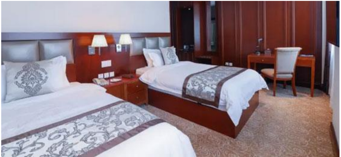
หรือ ที่พัก 4 ดาว Aurora Hotel Ulaanbaatar