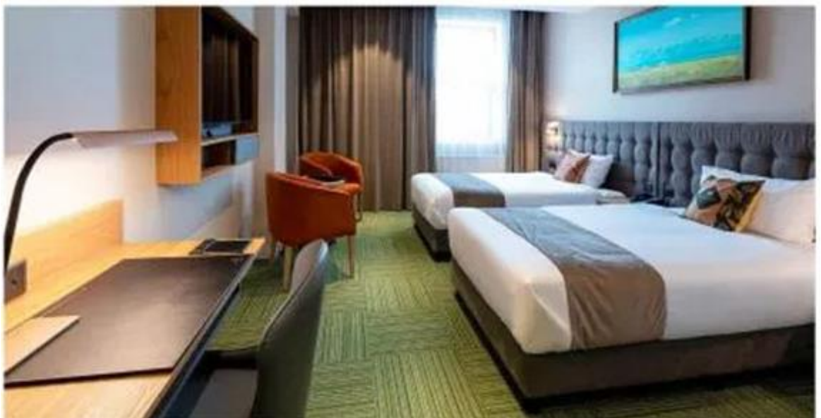
หรือ ที่พัก 4 ดาว Corporate Hotel Ulaanbaatar หรือเทียบเท่า 4 ดาว