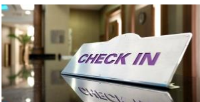
เช็คอินเข้าโรงแรมปูซาน

พาท่านสัมผัสประสบการณ์ใหม่กับการนั่งสกายแคปซูล บนรางรถไฟลอยฟ้า เลียบทะเลแฮอนแด เมืองท่าอันดับ1ของประเทศเกาหลีใต้ ตัวแคปซูลหนึ่งคันจะนั่งได้ 4ท่าน แต่ละแคปซูลก็จะมีสีสันสดใส น้ำเงิน แดง เหลือง เขียว เล่นสลับๆกันไป สีสวยตัดกับท้องฟ้า แล่นคู่ขนานกับรถไฟขมทะเลด้านล่าง ระหว่างนั่งในแคปซูลท่านจะได้ชมวิวเมืองปูซานได้ทั้งชายฝั่งและขวา แคปซูลจะแล่นช้าๆให้เราไปชื่นชมความงาม ของวิวทะเล และวิวตัวเมือง ถือว่าเป็นที่เที่ยวเปิดใหม่ล่าสุด ที่นำไปเที่ยวมากๆเลยทีเดียว