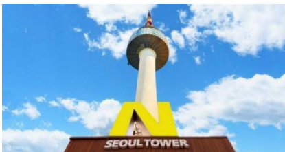
คืนได้แบบ 360 องศา

สวนสนุกล็อตเต้เวิลด์ สวนสนุกในร่มที่มีเครื่องเล่นมากมาย โดยพื้นที่ภายในจะแบ่งเป็น 2 โซนใหญ่ๆ คือ Adventure เป็นสวนสนุกในร่มที่รวมเครื่องเล่นไว้มากมาย ทั้งไวกิ้ง ม้าหมุน บ้านผีสิง ฯลฯ รวมถึงมีลานไอซ์สเก็ตในร่มอีกด้วย ส่วนอีกโซนชื่อว่า Magic Island เป็นโซนกลางแจ้ง อยู่ติดกับทะเลสาบชกซอนไฮชู มีปราสาทสวยๆ ตั้งเด่นเป็นสง่า ตรงนี้แหละจะเป็นจุดถ่ายรูปที่คนเกาหลีฮิตมากๆ ถ้าจะให้ปังสุดๆ ต้องเช่าชุดนักเรียนน่ารักๆ มาใส่ถ่ายรูปด้วยนะ โซนกลางแจ้งมีเครื่องเล่นไฮไลท์เป็น Gyro Drop ดรอปทาวเวอร์ สูง 70 เมตร และเครื่องเล่นมันส์ๆ อีกมากมาย ใครชอบความท้าทายต้องไม่พลาด