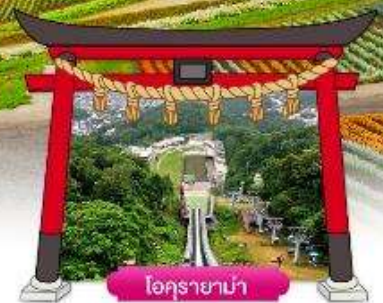
โอคุรายาม่า