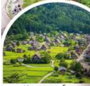
หมู่บ้านฮิราคาว่าโกะ