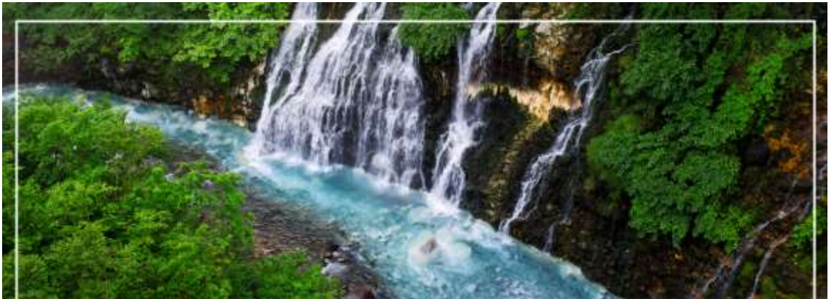
SHIRAHIGE WATERFALL น้ำตกชิราฮิเกะ

เช้า รับประทานอาหารเช้า ณ ห้องอาหารของโรงแรม (9) นำท่านเดินทางสู่ เมืองบิเอะ (Biei) (ใช้เวลาเดินทางประมาณ 1.10 ชั่วโมง) เมืองเล็ก ๆ ล้อมรอบด้วย