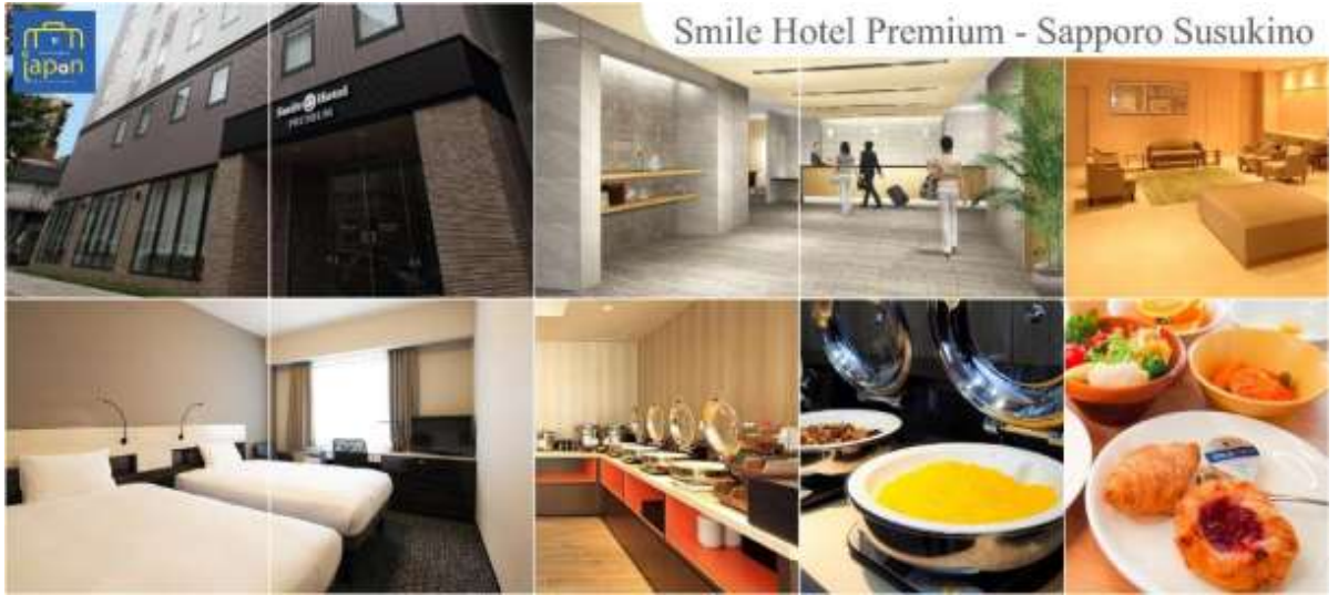
Smile Hotel Premium - Sapporo Susukino