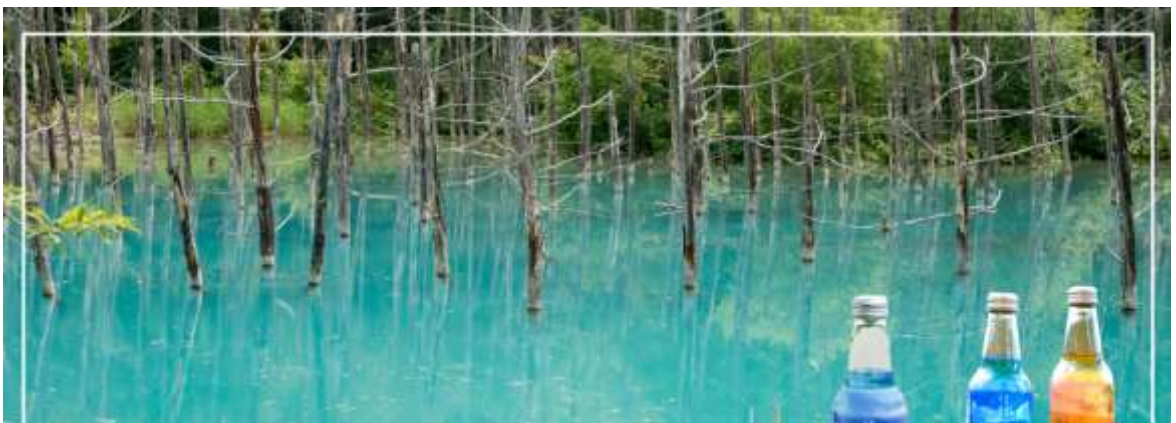
BLUE POND สระอะโออิเคะ

จากนั้นนำท่านชม สระอะโออิเคะ (Aoiike) หรือที่เรารู้จักกันอีกชื่อหนึ่งว่า "สระน้ำสีฟ้า (Blue Pond)" ห่างจากเทือกเขา Tokachi ประมาณ 2.5 กิโลเมตร นับเป็นแหล่งท่องเที่ยวที่เหมาะสมกับนักท่องเที่ยวสายสงบส่วนมากคนที่มาเที่ยวก็จะเป็นนักท่องเที่ยวต่างชาติ สาเหตุที่มีชื่อว่า สระอะโออิเคะ (Aoiike) หรือสระน้ำสีฟ้า (Blue Pond) นั้นก็เพราะว่ามีการตั้งชื่อตามสีของน้ำที่เกิดจากแร่ธาตุตามธรรมชาตินั่นเองโดยน้ำในส่วนนี้เพิ่งเกิดขึ้นจากการกันเขื่อนเพื่อป้องกันไม่ให้โคลนภูเขาไฟ Tokachi ที่ปะทุขึ้นเมื่อปี ค.ศ.1988 ที่ได้ไหลทะลักเข้าสู่เมืองนั่นเอง