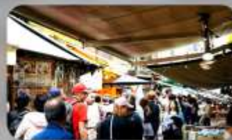
ตลาดปลาซึกิจิ