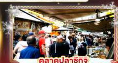
ตลาดปลาซึกิจิ