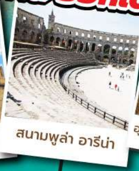
สนามพูล่า อารีน่า