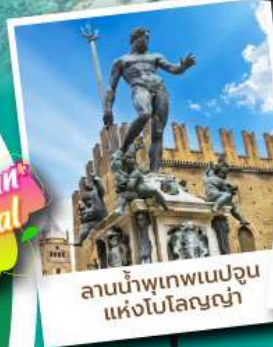
ลานน้ำพุเทพเนปจูน แห่งโบสถ์โลนญา