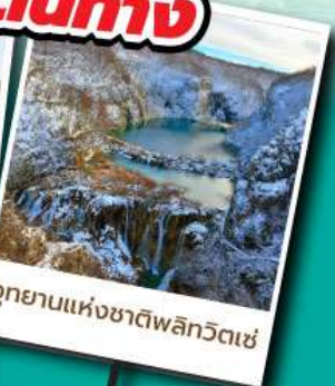
อุทยานแห่งชาติพลีทิวเซ