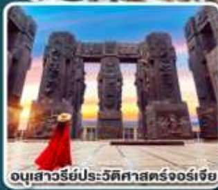
อนุสาวรีย์ประวัติศาสตร์จอร์เจีย