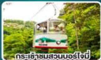
กระเช้าชมสวนบอร์โจบี