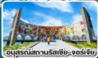
อนุสรณ์สถานรัสเซีย-จอร์เจีย