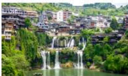
เมืองผู่หลงเจิน