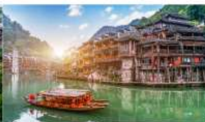
จางเจียเจีย