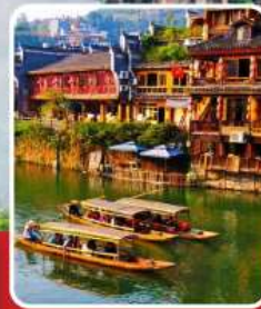
เมืองโบราณฟ่งหวง

อุทยานฉางเจียเจีย เขากียนจื่อซาน สะพานหนึ่งใบไต้หล้า ทะเลสาบเป่าเฟิงหู ตึกมหัศจรรย์ 72 ชั้น เมืองโบราณฟูหลงเจิน เมืองโบราณฟ่งหวง ล่องเรือแม่น้ำถิวเจียง สะพานสายรุ้ง ช้อปปิ้ง ถนนคนเดินหวงซิงลู่