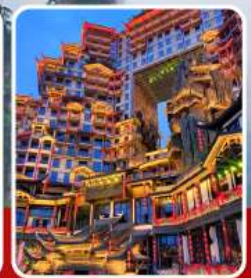
ตึก 72 ชั้น