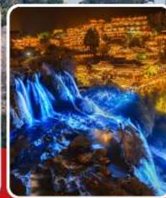
ฟูหลงเจิน