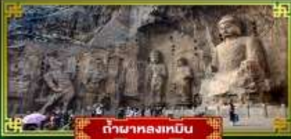
ถ้ำผาทองหมื่น