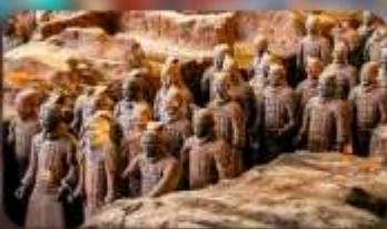
สุสานทหารฉินซี