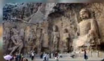
กำแพงหลงเหมิน