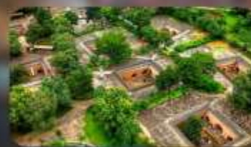
บ้านใต้ดินส่วนโจว