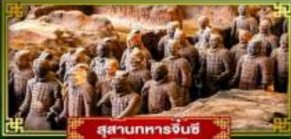
สุสานทหารจีนซี