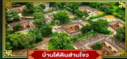
บ้านใต้ดินसानโจว