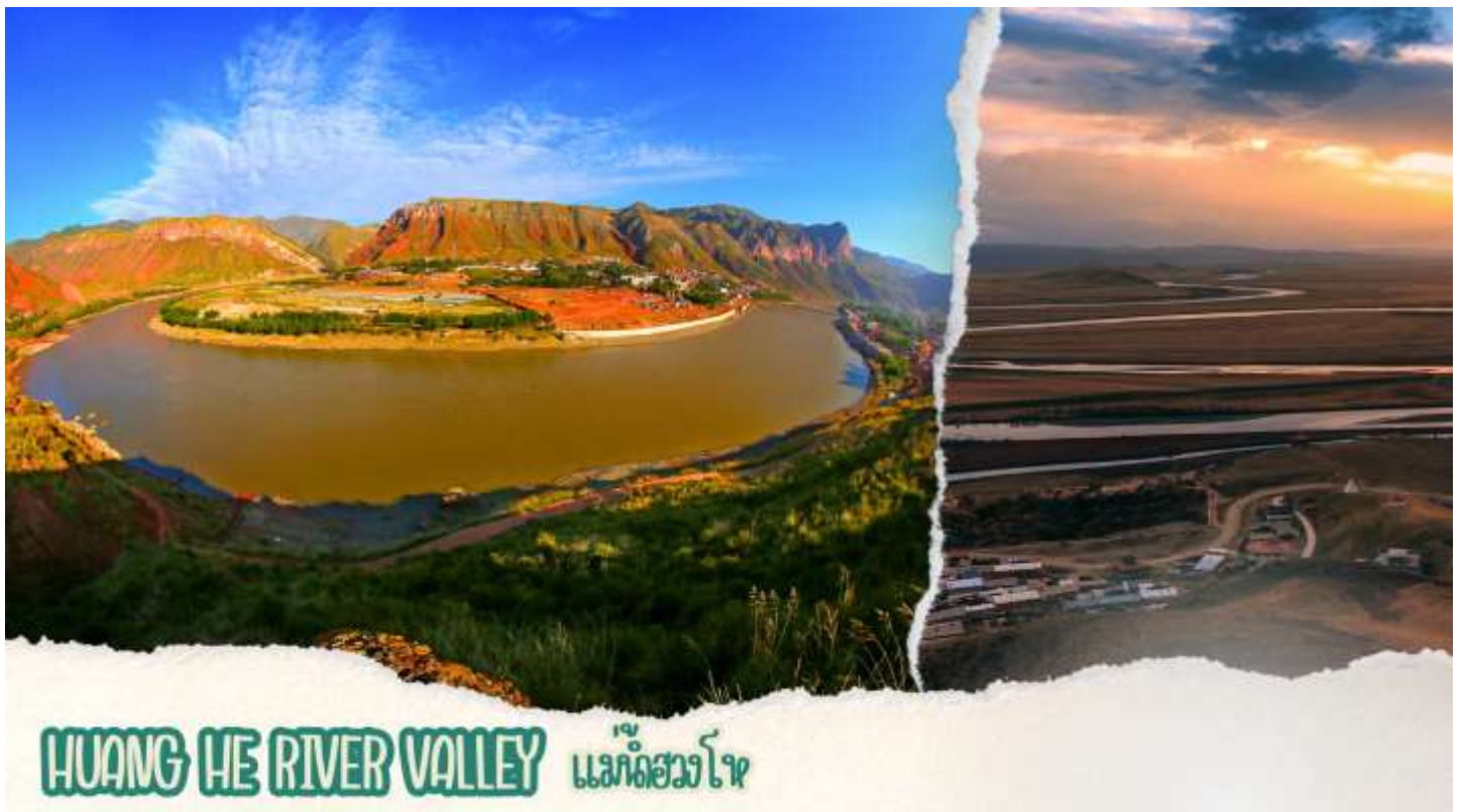
HUANG HE RIVER VALLEY แอ๋ตวี่ซือ

เช้า รับประทานอาหารเช้า ณ ห้องอาหารของโรงแรม (มื้อที่ 1)