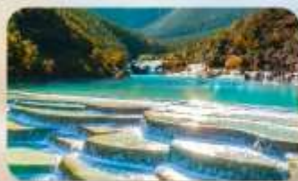
โป๋ส่วยเหอ