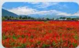
สวนฮวาอวี๋มู่ฉ่าง