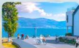
ทะเลสาบเอ๋อร์ไห่