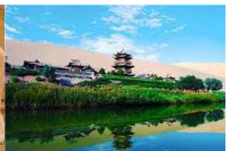
สระน้ำวพระจันกรี