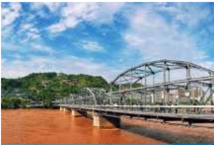
สะพานข้ามแม่น้ำฮวงโห