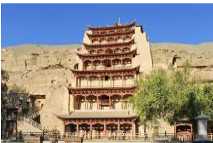
ถ้าห็นมั่วเกา

พักที่ METRO PARK HOTEL โรงแรมระดับ 4 ดาวหรือเทียบเท่าในเมืองตุนหวง