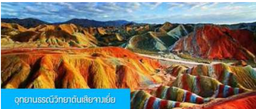
อุทยานธรณีวิทยาตึบเสียวายี่ย

พักที่ JIN WU INTER HOTEL โรงแรมระดับ 4 ดาวท้องถิ่น หรือเทียบเท่าในเมืองหวู่เว่ย