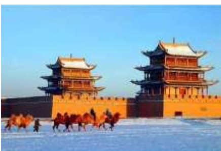
ด่านเจียยวี้กวน

พักที่ REZEN HOTEL ระดับ 4 ดาวท้องถิ่นหรือเทียบเท่าในเมือง เจียยวี้กวน