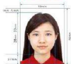
Paper Photo for Visa Application Form