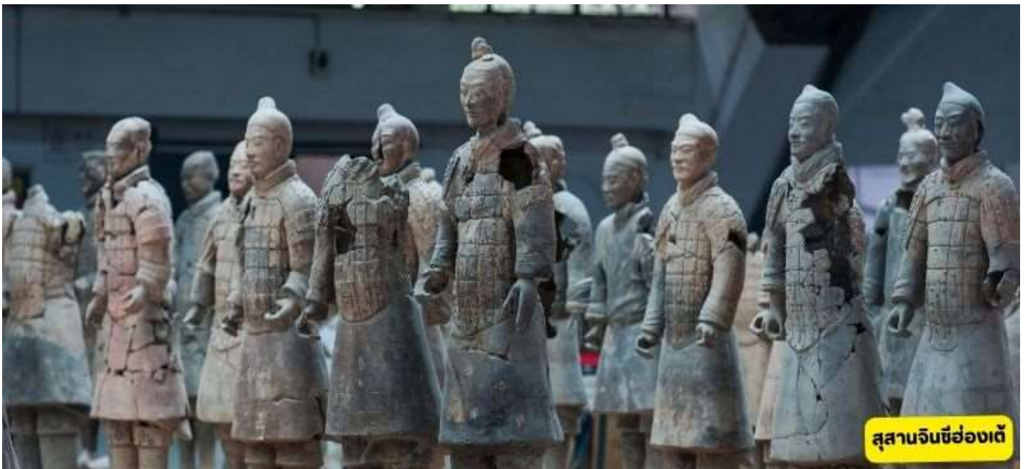
สุสานจินซีฮ่องเต้

สุสานจินซีฮ่องเต้ - วัดต้าเจี๋ยเอิน - เจดีย์ห่านป่าใหญ่ - ถนนต้าถังเมืองที่ไม่เคยหลับไหล