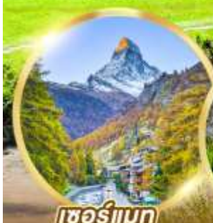
เซอร์แมท