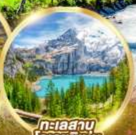
ทะเลสาบไอเอชซีเนน