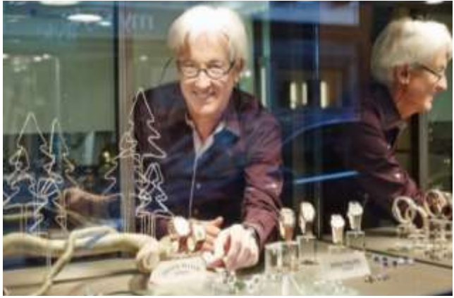
Highlight! สวิตเซอร์แลนด์เป็นผู้ผลิตนาฬิกาชั้นนำของโลก ใช้มาตรฐานการผลิตเข้มงวด วัสดุคุณภาพสูงสุด ผ่านการทดสอบอย่างละเอียด หากคุณกำลังมองหานาฬิกา ที่สวิสเป็นตัวเลือกที่สมบูรณ์แบบ 👍

เช้า 📌 รับประทานอาหารเช้า ณ โรงแรม (เมื่อที่9) จากนั้นนำท่านเดินทางสู่ เมืองซุก (ZUG) ประเทศ สวิตเซอร์แลนด์ (ระยะทาง 32 กม. / 30 นาที) เป็นเมืองที่ร่ำรวยที่สุดในประเทศ และซุกเป็นเมืองที่ติดอันดับหนึ่งในสิบของโลกเมืองที่สะอาดที่สุด นำท่านถ่ายภาพกับ หอนาฬิกา Zyturm เป็นหอคอยสูง 52 เมตรที่มีหลังคาที่มีลวดลายโดดเด่นเป็นสีฟ้าขาว และนาฬิกาที่ตั้งอยู่เป็นนาฬิกาดาราศาสตร์ ที่สามารถบอกข้างขึ้นข้างแรมของพระจันทร์ บอกวันในสัปดาห์ได้ด้วย อิสระ-ช้อปปิ้งที่ Lohri AG Store ที่มีนาฬิกาชั้นนำระดับโลกให้ท่านเลือกซื้อเลือกชม อาทิ เช่น Patek Philippe, Franck Muller Cartier , Piaget, Parmigiani Fleurier, Panerai, IWC , Omega, Jaeger-LeCoultre, lancpain, Tag Heuer ฯลฯ