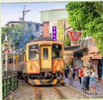
สถานีรถไฟซือเฟิ่น