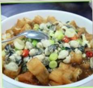
ถนนโบราณซือเฟิ่น