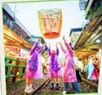
ปล่อยโคมลอย