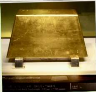
พิพิธภัณฑ์ทองคำ