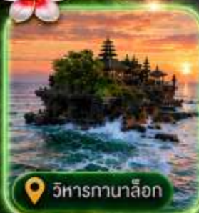
วิหารกานาล็อก