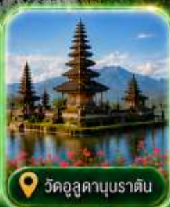
วัดอุสุदानุบราตัน