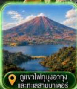
ภูเขาไฟบุงอากุง และทะเลสาบมาเตอร์