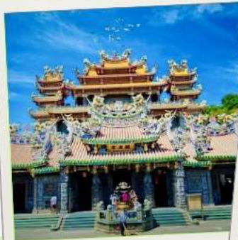
วัดกวนตู่