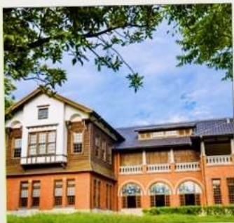
พิพิธภัณฑน์น้ำพุร้อนเป่ย์โถว