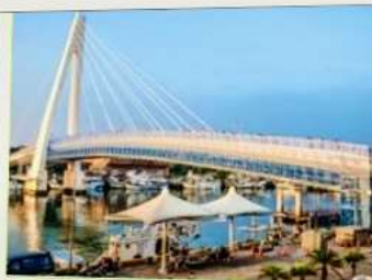
สะพานคู่รักตั้นส่วย