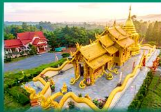
วัดเทพนิมิตประดิษฐ์