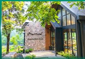
บ้านนาโพธิ์ สวนสวย 168

god like Thailand ชัยภูมิทุ่งดอกกระเจียว 4,991 เริ่ม