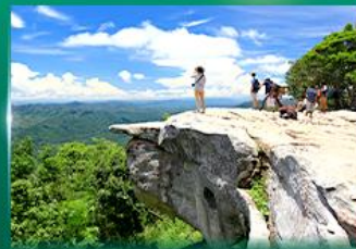
จุดชมวิวดาสุตาแผ่นดิน