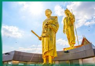
หลวงพ่อคูณ วัดบ้านไร่